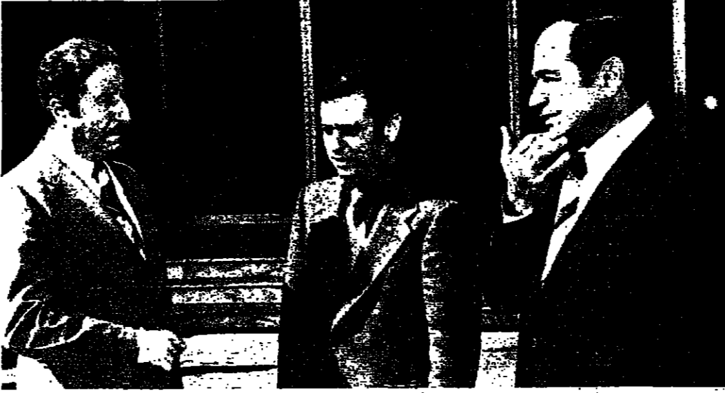
الوزير خدام واللواء شهسايي واللواء جيبيل لدى مشاهدتهم القصر الجمهوري في بعبدا أمس

انسحاب بيروت في «البعث»: بشائر مشجعة خلال الايام المقبلة قلت صحيفة «البعث» السورية امس: يبدو من خلال ما تناقلته الابواب الخاصة الرسمية، من العاصمة اللبنانية، ان الامم المتحدة ستجلب بشائر مشجعة بحلول ان تكون نهاية المباحثات للحدود الموقوتة التي اوتت بها الامم المتحدة، وانها كانت ترضى على استقلال لبنان ووحدة ارضه وشعبه، واولا واعني المصلحين من ابناءه والجهود الضمنية التي بذلتها سوريا طوال الترسيم، وما يشجعنا على التفاؤل تلك التكتيدات التي ورثت من بيروت خلال اليومين الماضيين، والقائلة ان تنفيذ اتفاق شذورا بالنسبة للجنوب سينفذ خلال الايام القادمة حيث ان كل الترتيبات قد اتخذت بهذا الشأن ولا توجد عقبات كبيرة تحول دون التنفيذ، وان كانت هناك بعض العقبات الصغيرة الفنية، الا ان ذلك ليس بالشيء الخطير، وما يؤكد ذلك ايضا هو توصل معظم الاطراف الى اتفاق مبدئي، ان الوطن فوق كل الاعتبارات والصالحات.